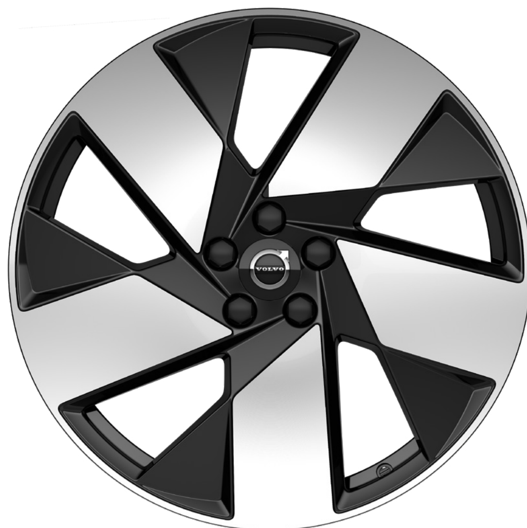
20" 5-Spoke Black Diamond Cut