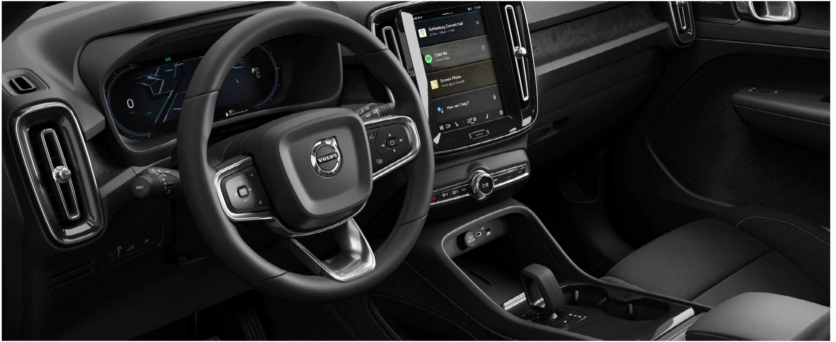
Charcoal & Charcoal