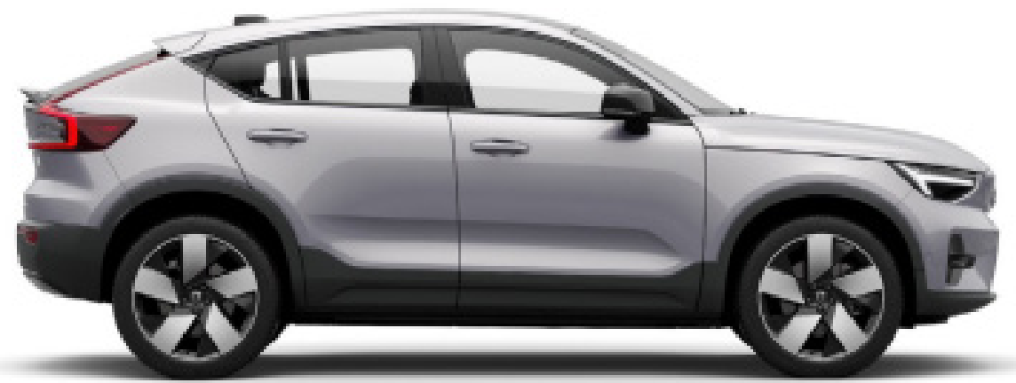
● Silver Dawn