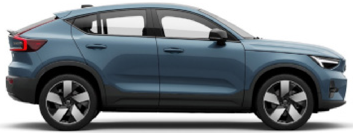
● Fjord Blue