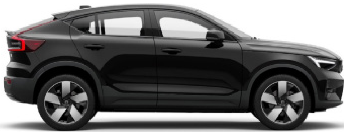
● Onyx Black