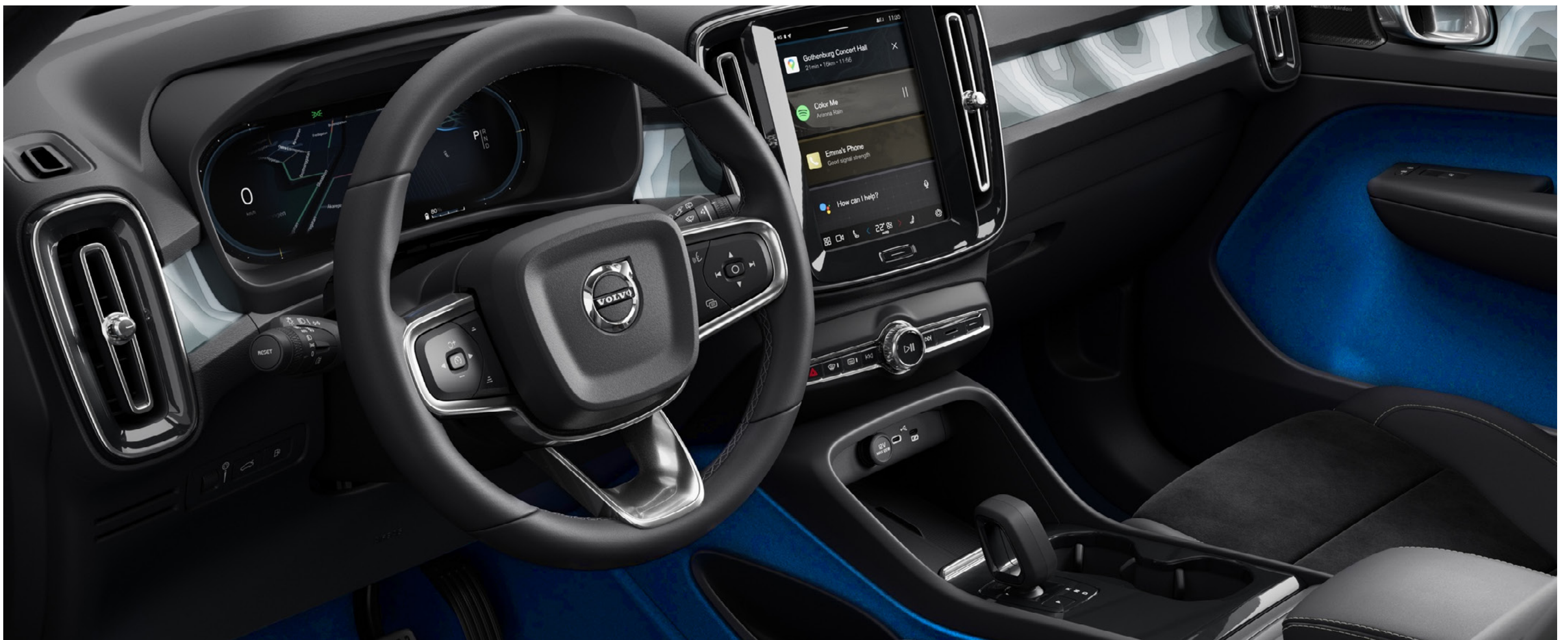
Charcoal & Fjord Blue