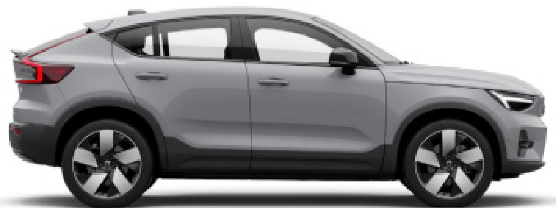
● Vapour Grey