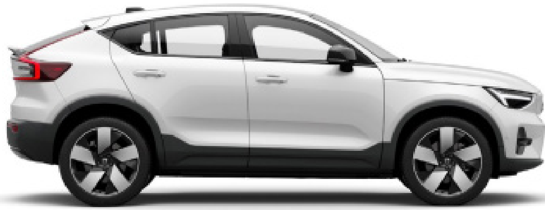
○ Crystal White