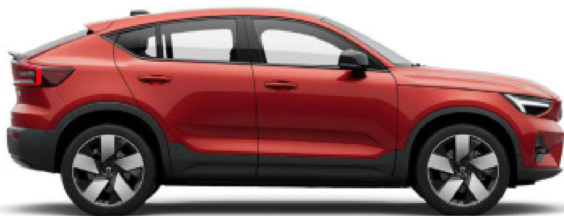
● Fusion Red