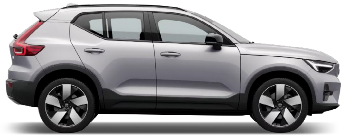
● Silver Dawn