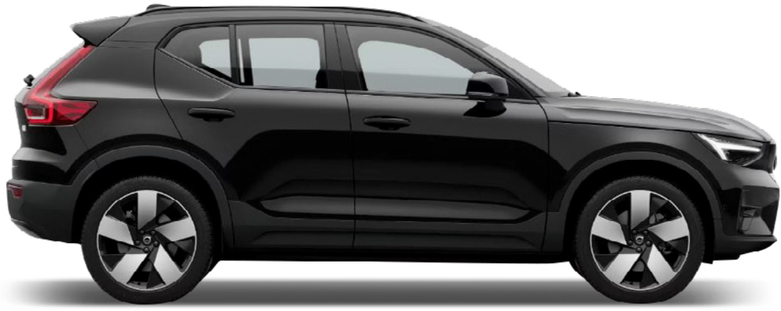
● Onyx Black