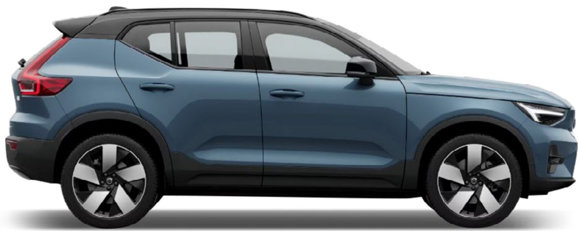
● Fjord Blue