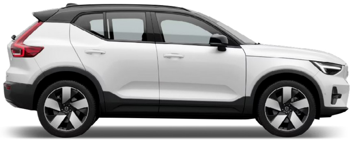
○ Crystal White