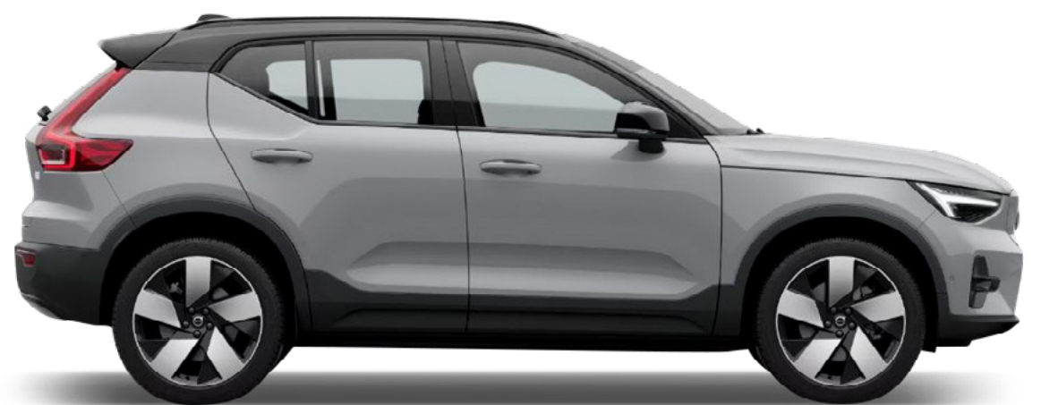
● Vapour Grey