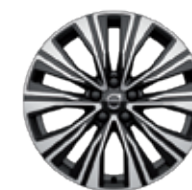
18英寸 豪华版 铝合金轮毂