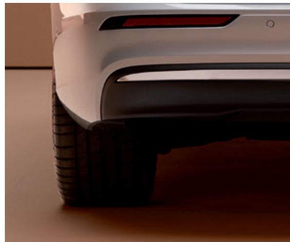
隐藏式排气尾管搭配亮色饰条，令车尾优雅而不失力量。