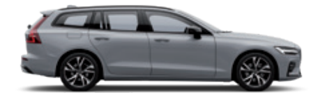
740 薄雾灰金属漆 (运动版专属)