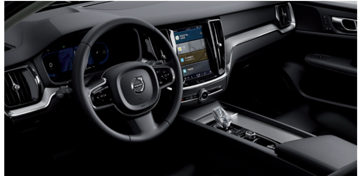
带电动腰靠调节和坐垫长度调节功能*的人体工程学Moritz座椅，与液晶数字仪表盘，共同营造北欧豪华感官体验。