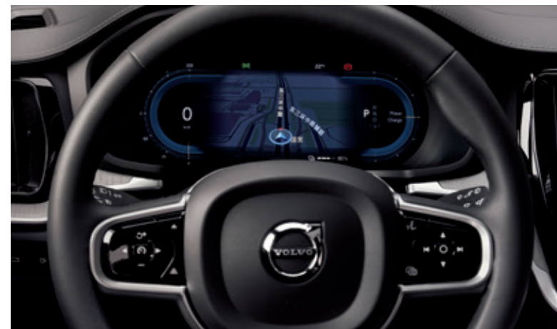
直观的12.3英寸液晶智能数字仪表盘提供两种图形显示模式，加之9英寸液晶触摸屏，助您掌控全程。