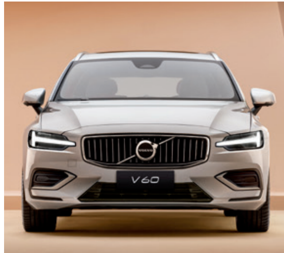
优雅的豪华风格前格栅，搭配标志性的“雷神之锤”LED大灯。

V60 豪华版，别致造型、珠光质感、精制轮毂，无处不彰显北欧豪华。进入车内，上乘材质与匠心工艺打造的座舱空间将进一步提升感官体验。V60 豪华版，遵从您的意愿表达动感豪华。