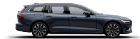
723 牛仔蓝金属漆 (豪华版专属)