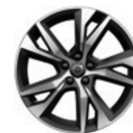
18英寸 运动版 铝合金轮毂