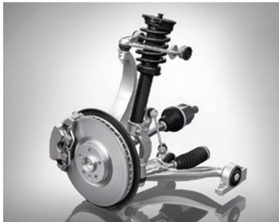
V60先进动力，带来纯粹动感驾趣。双叉臂前悬架，让操控更精准，掌控更充分。

正如您对一辆沃尔沃汽车的期待，V60不仅提供令人心潮澎湃的驾控体验，而且行驶在任何路面都具备优异的舒适性。