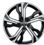
19英寸 运动版 铝合金轮毂