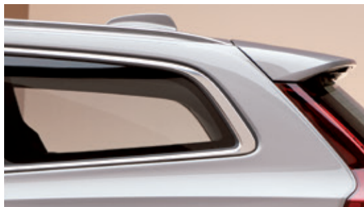
亮银色侧窗边框为V60 豪华版的外观增添豪华气息。