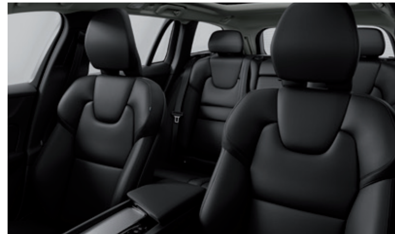
人体工程学座椅，提供舒适享受。