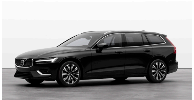
V60 Ultra B4