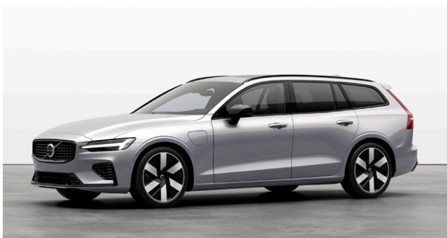
V60 Ultra T6 AWD plug-in hybrid