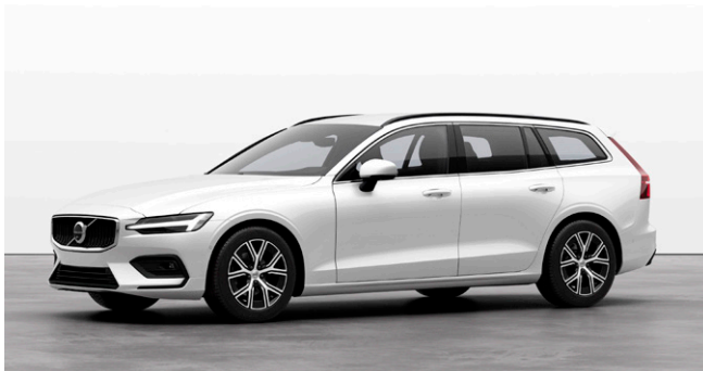
V60 Plus B4