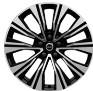
5マルチスポーク 8.0J×18インチ ダイヤモンドカット/ブラック