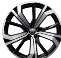
5ダブルスポーク 8.5J×21インチ ダイヤモンドカット/ブラック