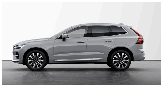
XC60 Ultra B5 AWD