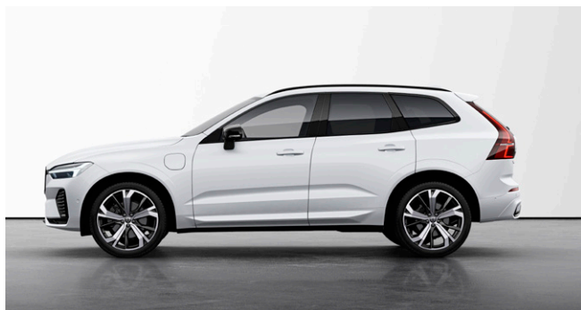
XC60 Ultra T6 AWD plug-in hybrid