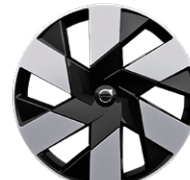
6スポーク 8.0J×20インチ ダイヤモンドカット/ブラック