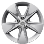
5スポーク 7.5J×18インチ シルバー