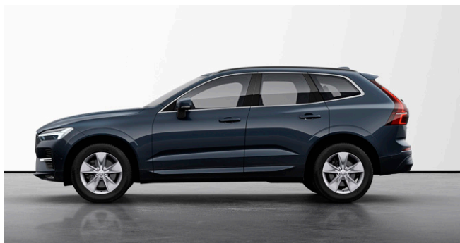
XC60 Plus B5