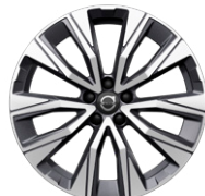
5-Vスポーク 7.5J×19インチ ダイヤモンドカット/ブラック