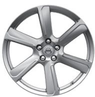
6スポーク タービン 8.0J×19インチ シルバー