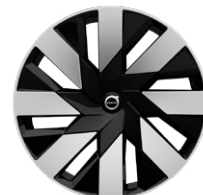
8スポーク 9.0J×21インチ ダイヤモンドカット/ブラック