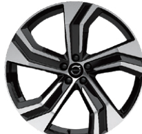
5ダブルスポーク 9.0J×22インチ ダイヤモンドカット/ブラック