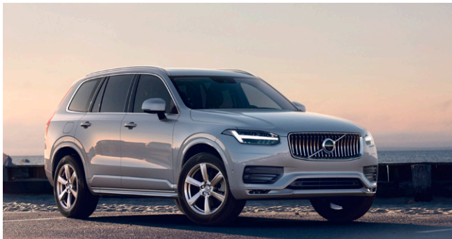
XC90 Plus B5 AWD