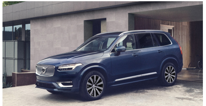
XC90 Ultra B5 AWD