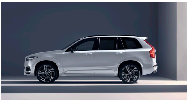
XC90 Ultra T8 AWD plug-in hybrid