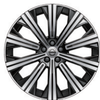
10スポーク 9.0J×20インチ ダイヤモンドカット/ブラック