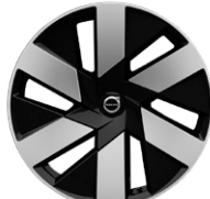
6スポーク 8.0J×19インチ ダイヤモンドカット/ブラック