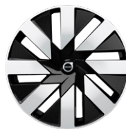
8スポーク 8.5J×19インチ ダイヤモンドカット/ブラック

Ultimate T8 AWD plug-in hybrid (オプション設定)