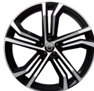
5ダブルスポーク 8.5J×20インチ ダイヤモンドカット/ブラック