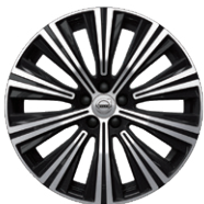
10スポーク 8.5J×19インチ ダイヤモンドカット/ブラック