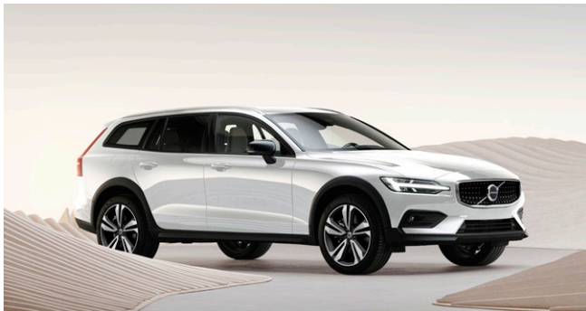
V60 Cross Country Ultra B5 AWD