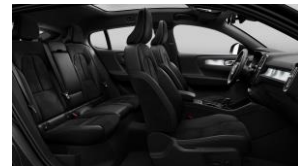
Charcoal Connect Suede Textile/ Microtech in Charcoal Interior