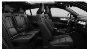
Charcoal Fusion Microtech/ Textile in Charcoal Interior