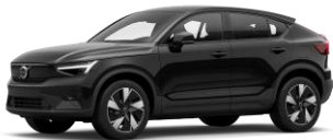
Onyx Black Metallic