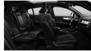
Charcoal Connect Suede Textile/ Microtech in Charcoal Interior