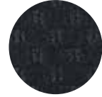
ウォーム ブラック

毛足が長くボリューム感があり、抜群の防音効果と断熱効果で、車内に静寂、快適な空間を提供します。