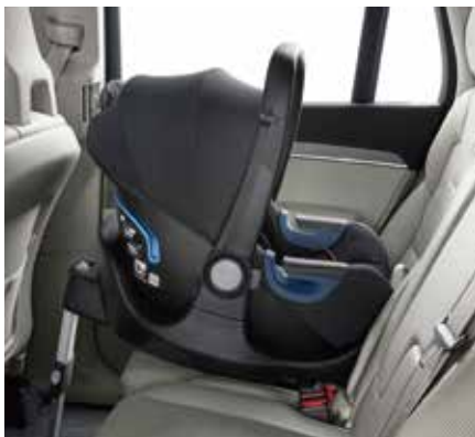
01 ベビーシート i-Size (在庫限り)

身長が40～73cmで体重が13kgまで、生後約10か月までの新生児に対応。この後ろ向きベビーシートは、高くクッションのきいた両サイドと、深い形状により、お子様をしっかりと保護します。