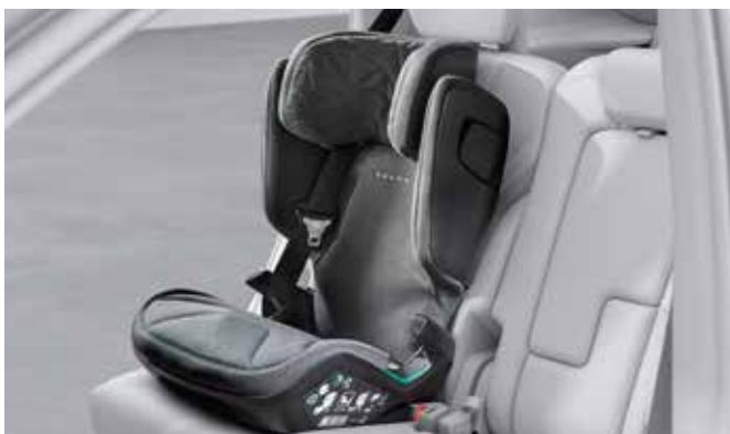
04 Volvoブースターシート

身長が105cm～150cmのお子様用です。ヘッドレストをさまざまに設定できるため、チャイルドシートに快適に座って移動できます。背もたれは簡単に取り外すことができます。お子様の身長が138cm～150cmになったら、ブースタークッションを個別に使用することができます。