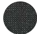
ツイード ブラック

天然ウールのようなしなやかな肌触りで特殊化学繊維の特長である実用性と耐久性に優れています。上品でシンプルなツイード調の織り柄は、ドライビング時、足の踏みしめ感でも高級さを感じていただけます。