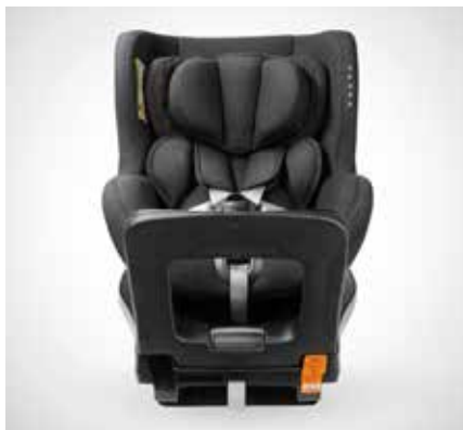
02 回転式チャイルドシート i-Size (在庫限り)

体重が18kg以下、身長40～105cm、新生児～4歳くらいまでのお子様用です。回転式なので乗せやすい。最新の安全基準R129をクリアした、角度も調整可能な次世代のチャイルドシートです。