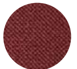
ツイード ボルドー