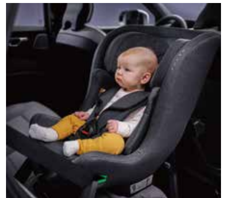
03 Volvo後ろ向きチャイルドシート

身長が61cm～115cmのお子様用です。ボルボでは、少なくとも4歳までは、後ろ向きに座っていただくことを推奨しています。お子様の快適な乗り心地に加え、安全性を提供します。