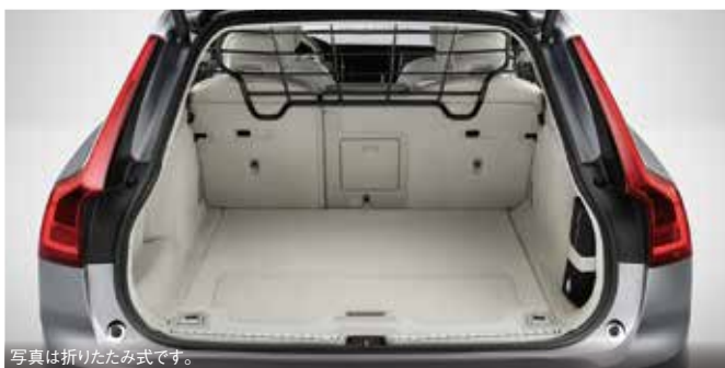
写真は折りたたみ式です。