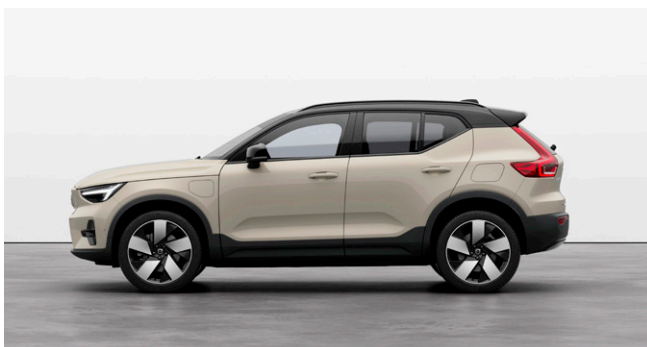
EX40 Ultra Twin Motor