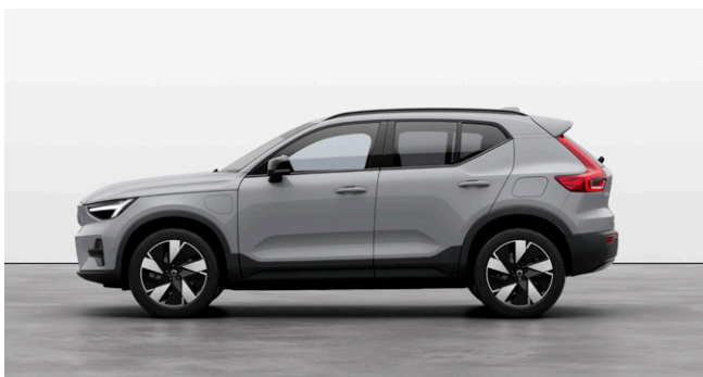
EX40 Plus Single Motor