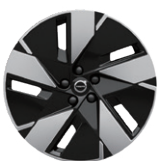
5スポーク フロント:7.5J×19インチ リア:8.5J×19インチ ダイヤモンドカット/ブラック