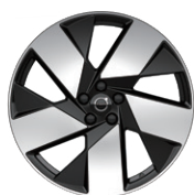
5スポーク フロント:8.0J×20インチ リア:9.0J×20インチ ダイヤモンドカット/ブラック