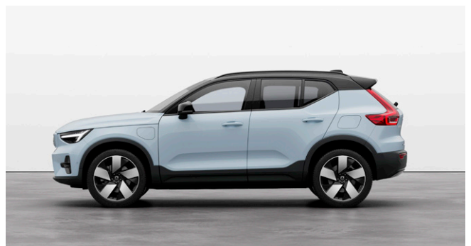
EX40 Ultra Single Motor