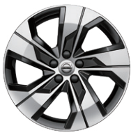
5スポーク 7.5J×18インチ ダイヤモンドカット/ブラック