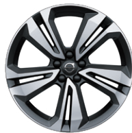
5ダブルスポーク 8.0J×19インチ ダイヤモンドカット/マットグラファイト