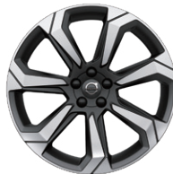
7スポーク 8.0J×20インチ ダイヤモンドカット/マットグラファイト