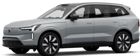
Vapour Grey Metallic