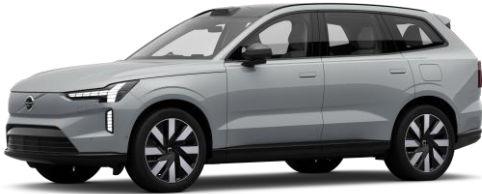
Vapour Grey Metallic