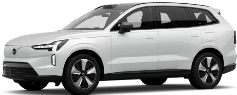
Crystal White Premium Metallic