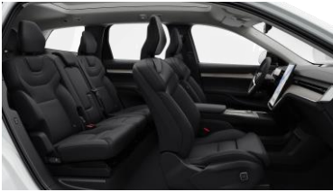
Charcoal Nordico in Charcoal interior