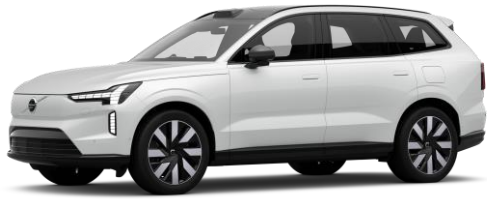
Crystal White Premium Metallic