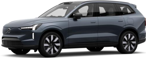
Denim Blue Metallic