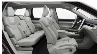
Ventilated Dawn Nordico in Dawn interior