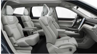
Ventilated Dawn Nordico in Dawn interior