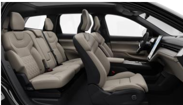
Cardamom Quilted Nordico in Charcoal/Cardamom interior