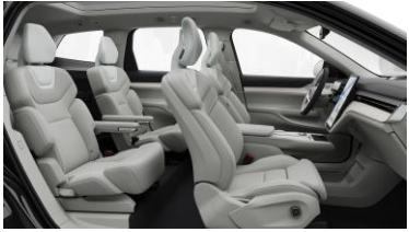
Ventilated Dawn Nordico in Dawn interior