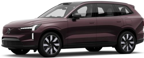
Mulberry Red Metallic