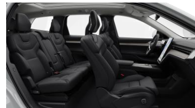
Ventilated Charcoal Nordico in Charcoal interior