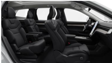
Ventilated Charcoal Nordico in Charcoal interior