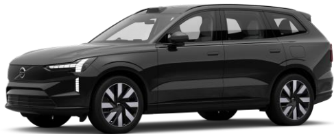
Onyx Black Metallic