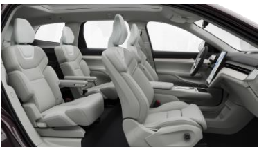
Ventilated Dawn Nordico in Dawn interior