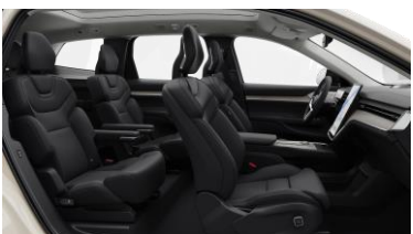
Ventilated Charcoal Nordico in Charcoal interior