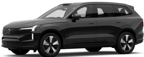
Onyx Black Metallic