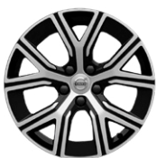
5-Yスポーク 7.0J×17インチ ダイヤモンドカット/ブラック