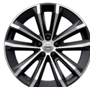
5ダブルスポーク 8.0J×18インチ ダイヤモンドカット/ブラック