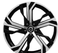
5トリプルスポーク 8.0J×19インチ ダイヤモンドカット/ブラック