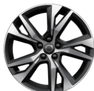
5スポーク 8.0J×18インチ ダイヤモンドカット/ブラック