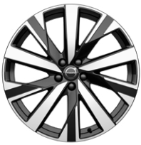
5マルチスポーク 9.0J×20インチ ダイヤモンドカット/ブラック