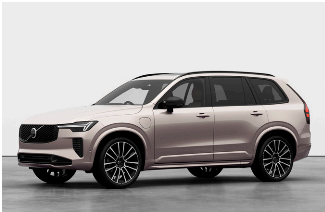
XC90 Ultra T8 AWD Plug-in hybrid