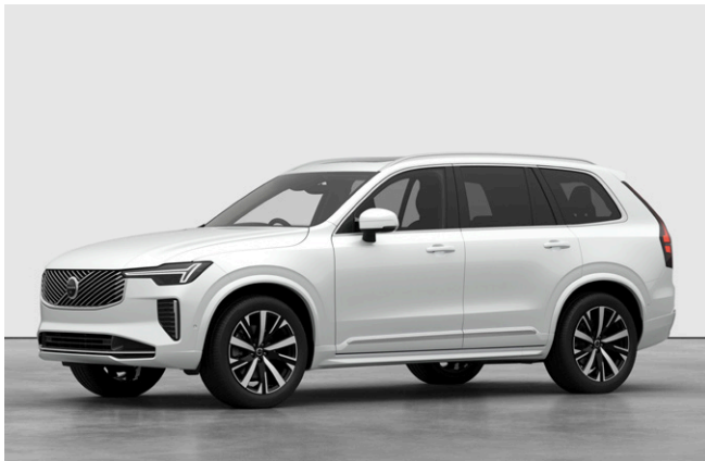
XC90 Plus B5 AWD