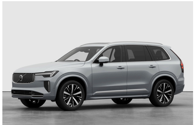
XC90 Ultra B5 AWD