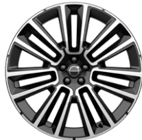
7ダブルスポーク 9.0J×22インチ ダイヤモンドカット/ブラック