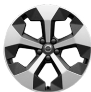
5-Yスポーク 7.5J×19インチ ダイヤモンドカット/マットグラファイト

Ultimate B4 AWD Dark Edition / Ultimate B4 AWD