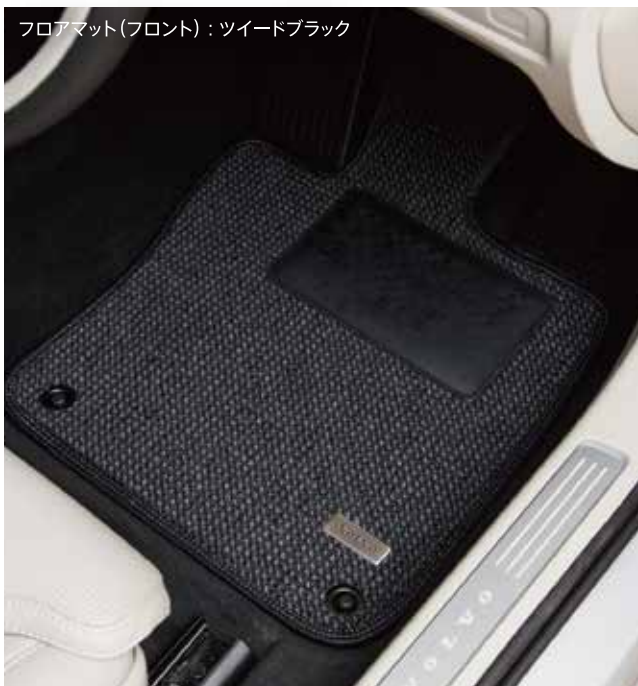
フロアマット(フロント) : ツイードブラック

天然ウールのようなしなやかな肌触りで特殊化学繊維の特長である実用性と耐久性に優れています。上品でシンプルなツイード調の織り柄は、ドライビング時、足の踏みしめ感でも高級さを感じていただけます。