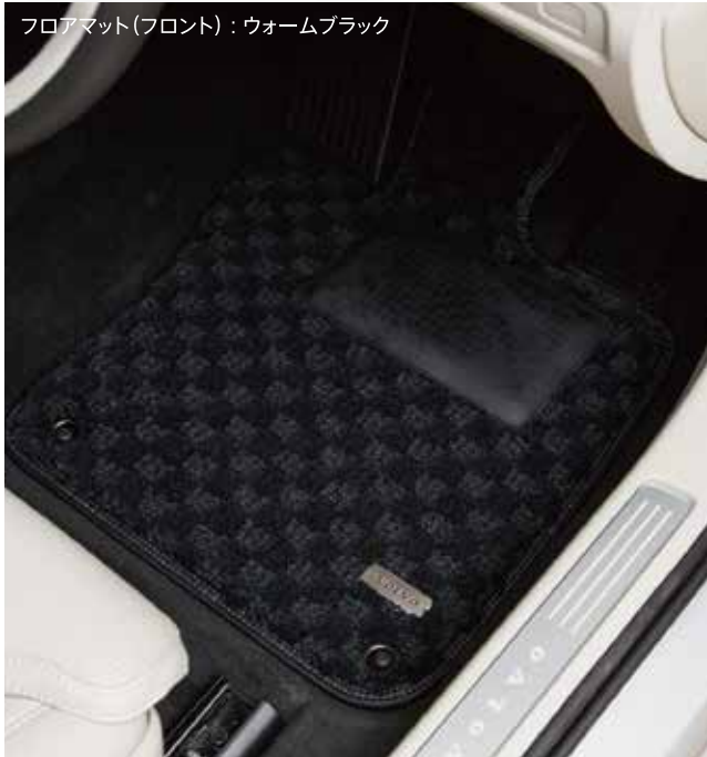
フロアマット(フロント) : ウォームブラック

毛足が長くボリューム感があり、抜群の防音効果と断熱効果で、車内に静寂、快適な空間を提供します。