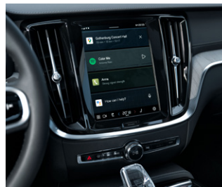
タッチスクリーン式センターディスプレイ (9インチ)

Googleを搭載したインフォテインメント。「OK Google」と話しかけるだけで、クルマに乗っていないながら、経路検索、通話、メッセージの送信をしたり、エンターテインメントを楽しむことができます。