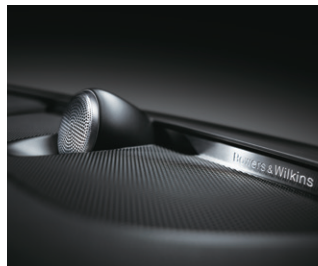
Bowers & Wilkins プレミアムサウンド・オーディオシステム (1,410W、15スピーカー)サブウーファー付

先進の機能と快適なドライビングフィールを実現し、上質な特別装備を搭載したモデルの証としてClassicエンブレムを装備。