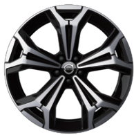
5 Yスポーク 7.5J×19インチ ダイヤモンドカット/ブラック