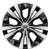
5ダブルスポーク 7.5J×18インチ ダイヤモンドカット/ブラック