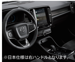
テイラード・シルクメタル・ スポーツステアリングホイール