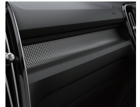
カッティングエッジ・ アルミニウム・パネル

室内空間もあなたの思いのまま。スマートフォンのように直感的な操作で扱える Google 搭載インフォテインメントを、ぜひご体感ください。