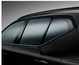
グロッシーブラック・トリム (サイドウィンドー・トリム / インテグレートッド・ルーフレール)