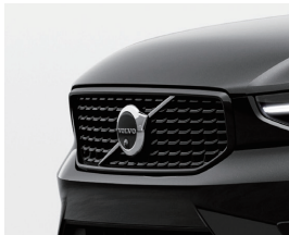
グロッシーブラック・ フロントグリル (格子状グリル)